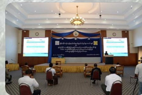
2020年Covid-19啓発プログラム