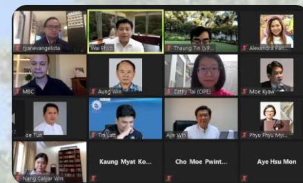
アドボカシー能力育成会議 2020