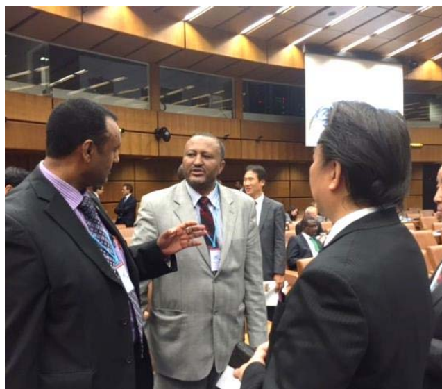
2014年11月 国連UNIDO主催 ISID フォーラムに参加 ウィーンにて