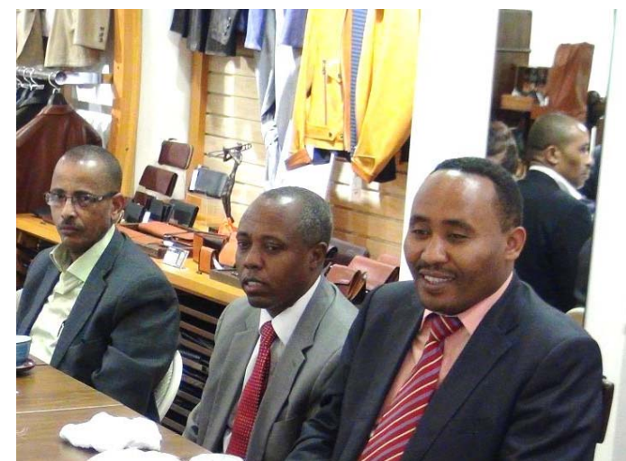
2014年8月 ムクタール・ケドウル オロミア州大統領来社