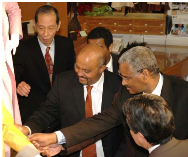
2009年3月 タデッセ・ハイレ貿易産業国務大臣(当時) 来社