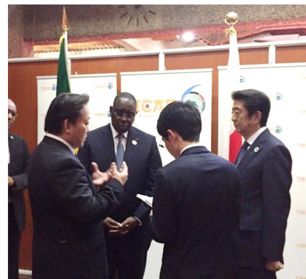
2016年8月 TICAD VI (ケニア) 本会議場にて安倍首相と