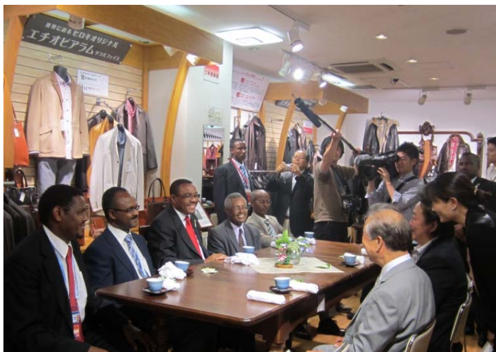
2013年6月ハイレマリム デッサレン首相(当時) 他、各省の大臣がヒロキ本社に来社