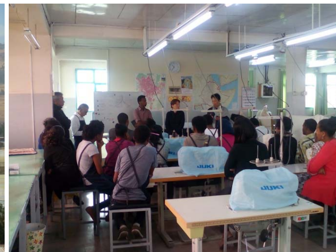
ミーティング風景