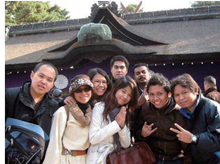
日本で初詣をする研修生