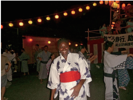
研修センターで行なわれた盆踊りに参加する研修生