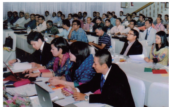
「第4回WNFセミナー 日本的経営研修」の研修風景

本研修では、WNF 基金による補助を受け、インドの同窓会関係者が専門家として講師を務めるとともに、パキスタンの同窓会関係者が同研修に参加しました。