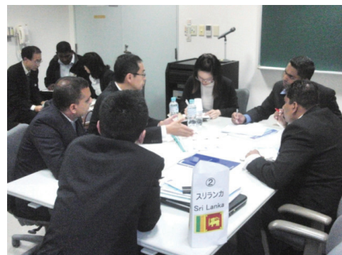
廃水処理技術に関するビジネス交流会 (関西研修センターにて)

HIDAでは、このように地元自治体や経済界と協力しながら、日本と海外の産業人材が交流できる機会を積極的に設け、人材育成の場をビジネス機会創出の契機として有効に活用する取り組みを広げていきます。