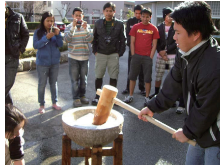
餅つき行事に参加する研修生

様々な国籍の研修生が生活する研修センターは、貴重な国際交流の場となっており、食堂やロビーでは日々研修生同士が交流を深めています。また、研修センター主催の研修生福利厚生行事では、年末年始の餅つきや初詣、盆踊り、七夕・節分・節句に関する行事、着物の着付けなど研修生が日本の文化や伝統に対する理解を深めるためのイベントを数多く行いました。