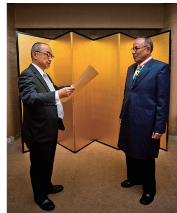
表彰を受けるイスラム氏(右)

2012年秋の外国人叙勲として、元AOTS同窓会会長のモハマド・ヌルル・イスラム氏（現：在チッタゴン日本国名誉総領事）が、日本・バングラデシュ間の相互理解促進及び友好親善に寄与された功労を称えられ、旭日中綬章を受章されました。