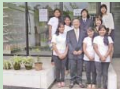
農村部の女性自立のために日本式のパン屋も立ち上げています。

ネパールには、帰国研修生が農村支援活動のために立ち上げたNGO組織「ラブ・グリーン・ネパール」があります。日本での研修を通し日本社会の平等意識、労働倫理、問題解決手法等に大きな影響を受けて始まったものです。農村部での公立学校の建設や女子生徒への奨学金支給、土壌の保全のための植林、バイオガス・プラントの建設による薪の節約と二酸化炭素排出量の削減、有機栽培による収入の増加と持続可能な農業の推進、健康センター等の建設による地域社会インフラの開発等、多くの成果を上げ、その活動は草の根レベルのネパールと日本の架け橋になっています。