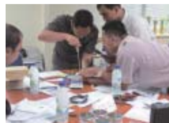
PLCの演習作業中の参加者 (ポリテクニク教員)

また、これら産業では、労働者賃金や原材料費の高騰等により生産の効率化・自動化が迫られている一方で、必要能力を備えた現地人技術者の数が非常に不足していることも明らかとなりました。こうした状況を改善するためには、継続的に人材を輩出する人材育成基盤を整備することが不可欠であり、本調査において、大学を中心とした将来的な人材育成基盤整備モデルについて提言を行いました。