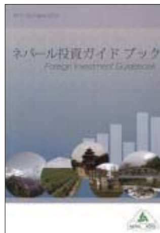
投資ガイドブック

かねてより要望の高かつた、ネパールへの投資に際して必要となる手続きや法制度等の基礎情報を一覽的に示した投資ガイドブックが、ネパールAOTS同窓会のイニシアティブと監修により、2014年7月に完成致しました。