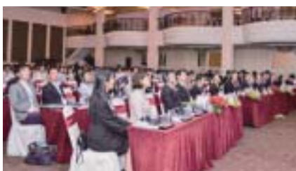
ベトナムでのカンファレンス

開催した4カ国すべてにおいて各国自動車産業における主要企業のトップあるいは上級管理者による講演が行われ、高い関心を集めました。日本から参加の日本企業、現地の日系企業、そしてローカル企業の実業家が一同に会し交流できる非常に貴重な機会であったことも内外の参加者から高く評価されました。海外における産業別人的ネットワークの蓄積というHIDAとHIDA/AOTS同窓会の圧倒的な強みがいかに発揮されたことにより、このように日本企業・日系企業とローカル企業をつなぐ場を創出することができました。