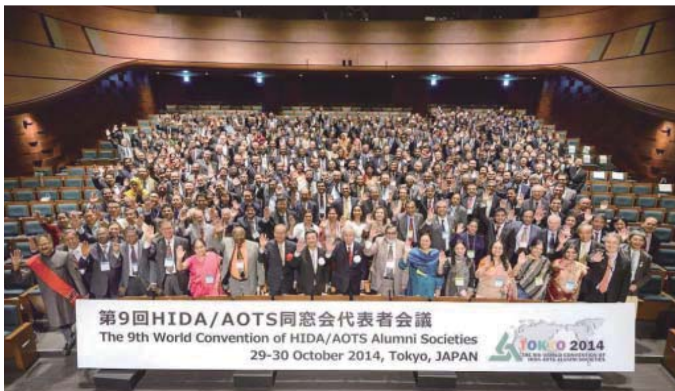
開会式全出席者による集合写真

ひとつぐりで結んだHIDAグローバルネットワークのこれから ～次代を拓く新たな価値を共に創造する～