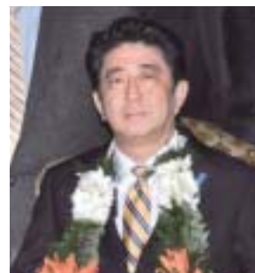
インドHIDA/AOTSデリー同窓会が開催した品質経営セミナー(2014年1月)をご視察される安倍晋三内閣総理大臣

安倍内閣総理大臣から寄せられた祝辞を経済産業省の山際大志郎副大臣が代読されました。安倍内閣総理大臣からはご自身のHIDA/AOTSとの関わりの紹介とともに協会事業に対する深いご理解と励ましをいただきました。