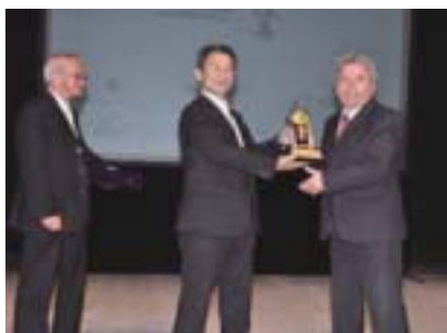
ペルーでの5S大会受賞式

同窓会は、AOTS/HIDAの研修で学んだ5S活動、生産管理、品質管理等を自国で広める活動を積極的に行っています。5S活動を導入し生産性を向上した優秀企業を表彰する5Sコンテストの先駆者であるスリランカ同窓会(JASTECA)は、毎年、コンテストを実施しており、2014年度のコンテストは19回目となりました。同様の5S大会はバングラデシュ(チッタゴン、ダッカ)の同窓会も開催しています。また、2014年度、HIDAは同窓会との連携により、ペルー及びパラグアイの2カ国にて5S・カイゼンセミナーを実施し、ペルーでは、同国初の5S大会を同窓会が主催し実施しました。