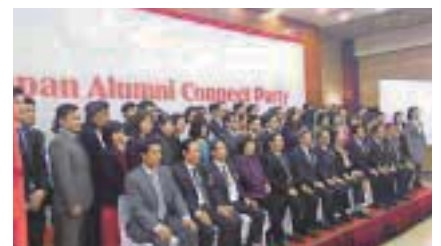
林大臣(当時)とベトナム帰国研修生、留学生による記念写真